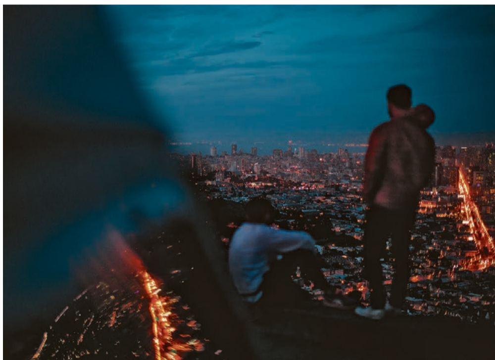
Die eigenen Sehnsüchte zu erkennen, ist gar nicht so leicht.