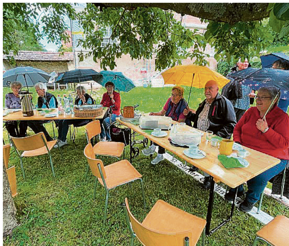
Die Seniorinnen und Senioren freuten sich auf einen unterhaltsamen Nachmittag.

Dann musste der Anlass wegen Starkregen in den Pfarrsaal verlegt werden. Der letzte «Sunneblätz» vor der Sommerpause endete aussergewöhnlich und unvergesslich.