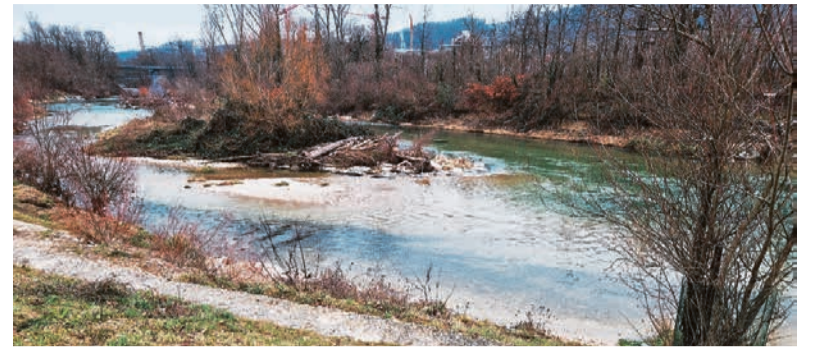
Eindrücke für die kommende Montagswanderung

5 Minuten. Dort haben wir die Wahl: Mit dem Bus Nr. 80 via Hülften bis Schöndal, jeweils XX.08 Uhr und XX.38 Uhr oder mit der S3 Richtung Olten um XX.11 Uhr und XX.41 Uhr (= 3 Zonen; Halbtax 4.20 Franken, Normalpreis 6.60 Franken) HORST BAUERSACHS Treffpunkt: Montag, 3. Februar, 13 Uhr, Bahnhof Frenkendorf Nächste Wanderung: Montag, 3. März