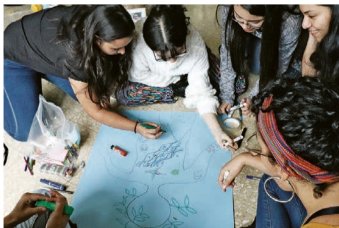
Die Casa DEI bietet auch Schulungen für Personen, die sich für Menschenrechtsaktivistinnen und -aktivisten einsetzen.