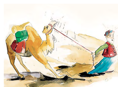
«So ein Kamel!», Weihnachtssingspiel.

Proben: Samstag, 16. und 23. November, 10–12 Uhr, Thomaskirche Adligenswil; Mitt-