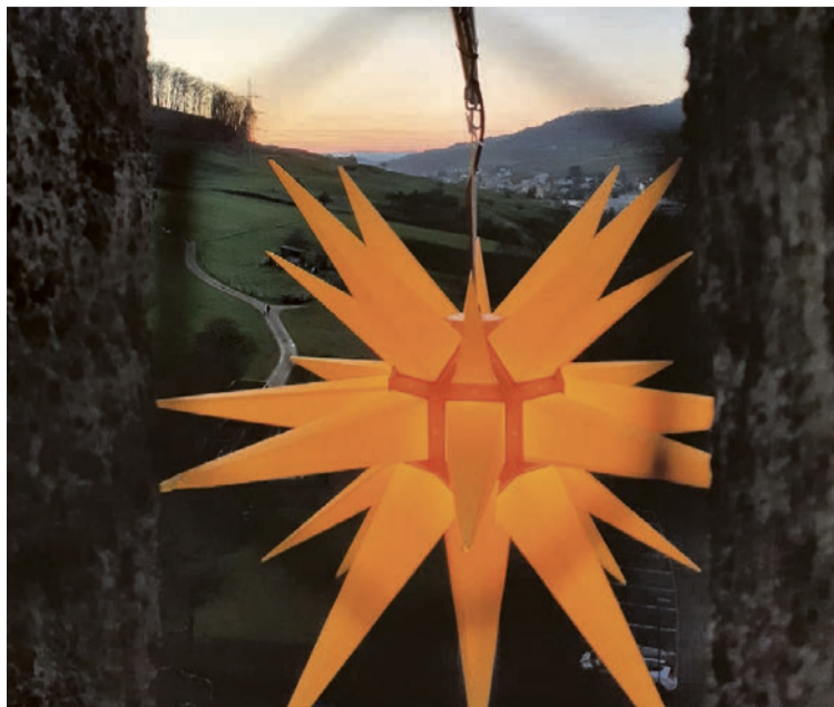
Herrnhuter Stern an der Kirche Ormalingen. RICHI SCHOLER