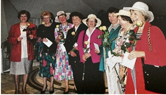
Modeschau des Reformierten Frauenvereins mit Kleidern aus dem Fundus der Brockenstube (ca. 1980)