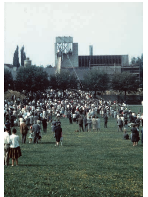
Aufzug der Glocken der Titus Kirche durch Schölerinnen und Schüler des Quartiers.

Unser Jubiläum ist ein schöner Anlass, unsere Kirche kennenzulernen. Wir freuen uns darauf, Ihnen zu begegnen und Sie bei uns willkommen zu heissen.