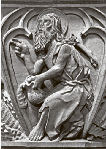
Johannes der Täufer auf dem Taufbecken im Münster.

Am Johannistag, 24. Juni , sind wir unterwegs im Münster. Das Programm führt vom ersten bis zum letzten Sonnenstrahl durch Stille, Klang und Raum. Gemeinsam mit der Weggemeinschaft Bethesda und den Living Stones nehmen wir uns Zeit für liturgische Feiern, Pilgerspaziergänge, erkunden die Schätze des Raums und erleben spirituelle Impulse. Für das Tagesprogramm ist eine Anmeldung nötig, siehe: www.baslermuenster.ch/tag-des-muensters .