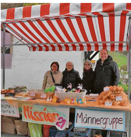
Mitglieder der Männergruppe und von Mission 21 beim Verkauf von Ostereiern und Zöpfen.