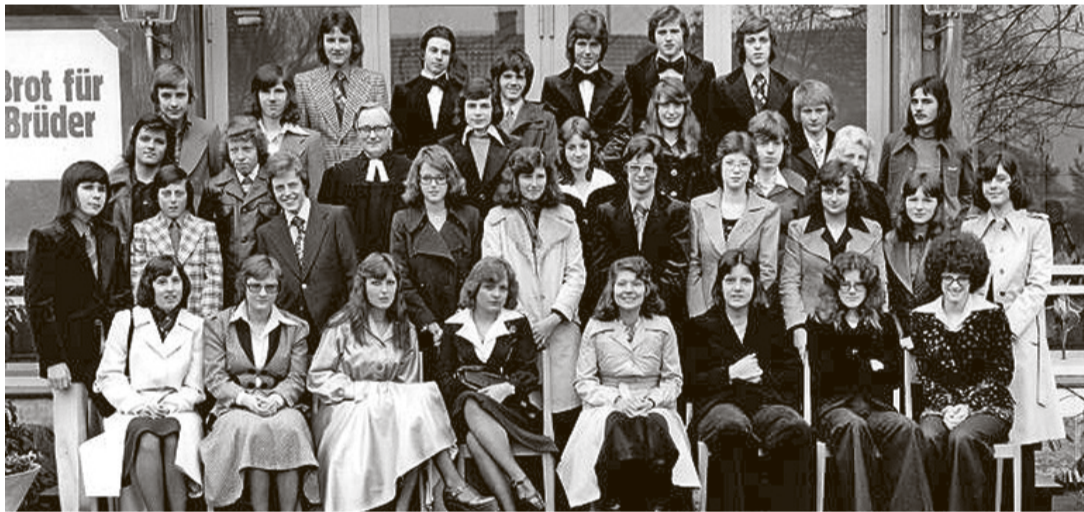
Konfirmandinnen und Konfirmanden im Jahr 1975.