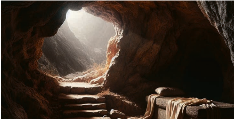
Das Grab Jesu war am dritten Tag leer.