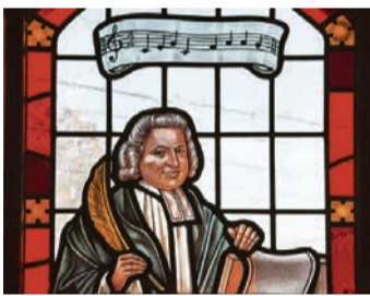
Charles Wesley, Autor zahlreicher Kirchenlieder.

Unser Schneelager für Jugendliche (ab 12 Jahren) und Eltern findet von 1. bis 7. März in Lenzerheide statt. Zu Hause sind wir im Haus Pardi in Lenz/Lantsch. Wir werden durch den Schnee pflügen – oder darüber hinweggleiten – mit Ski, Snowboard und Schlitten oder tanzen Sonnenlicht bei einer gemütlichen Winterwanderung. Ist man hungrig von der frischen Luft, darf auch das gute Essen nicht zu kurz kommen. Anmeldefrist: 7. Februar, die Teilnehmerzahl ist limitiert, also schnell anmelden! www.baslermuenster.ch/schneelager