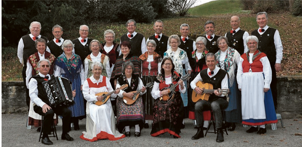
Corale pro Ticino Lucerna.